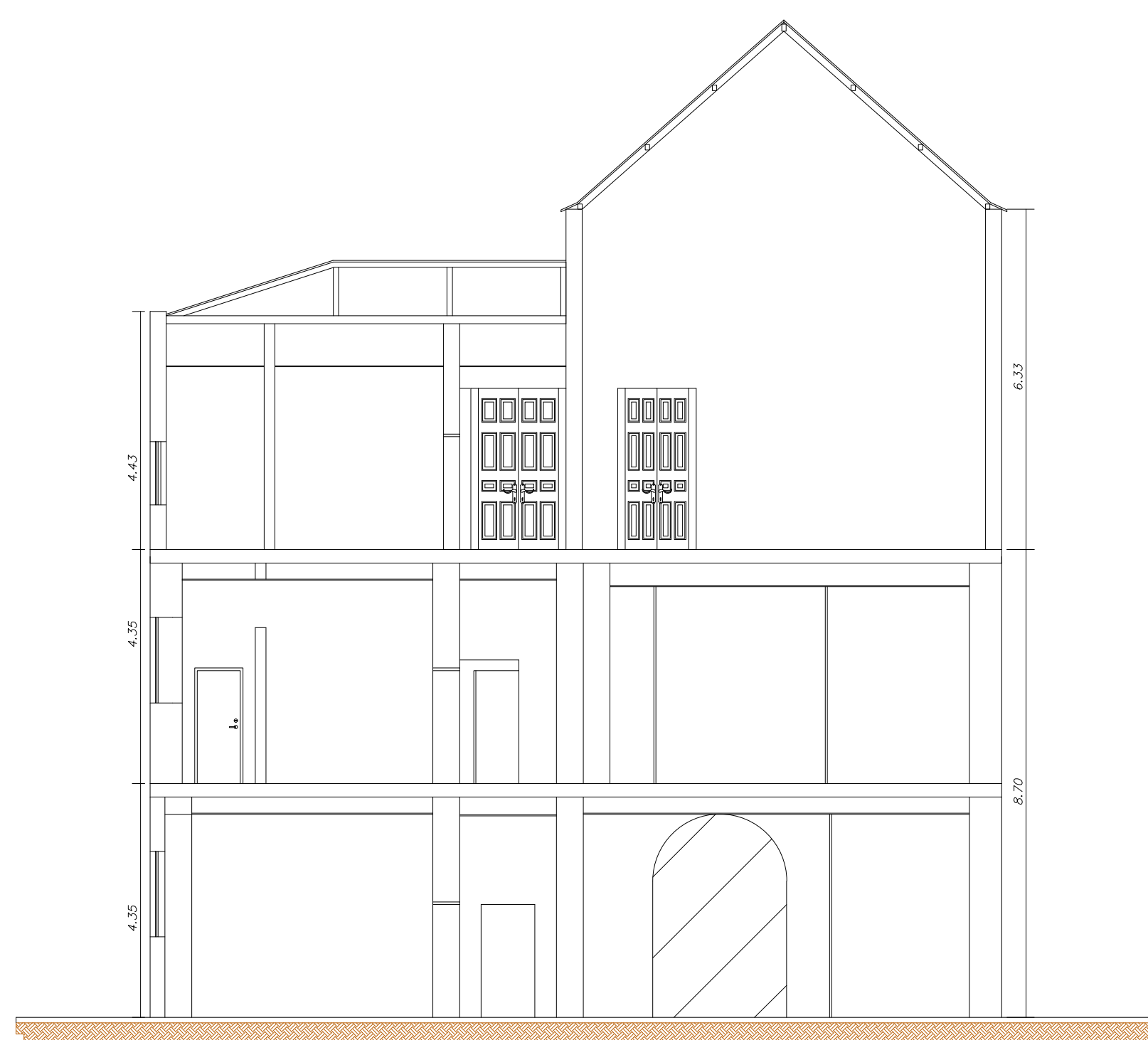
Corte B-B Esc: 1:100

POLÍCIA MILITAR DO ESTADO DE SÃO PAULO CORPO DE BOMBEIROS SERVIÇO DE SEGURANÇA CONTRA INCÊNDIO