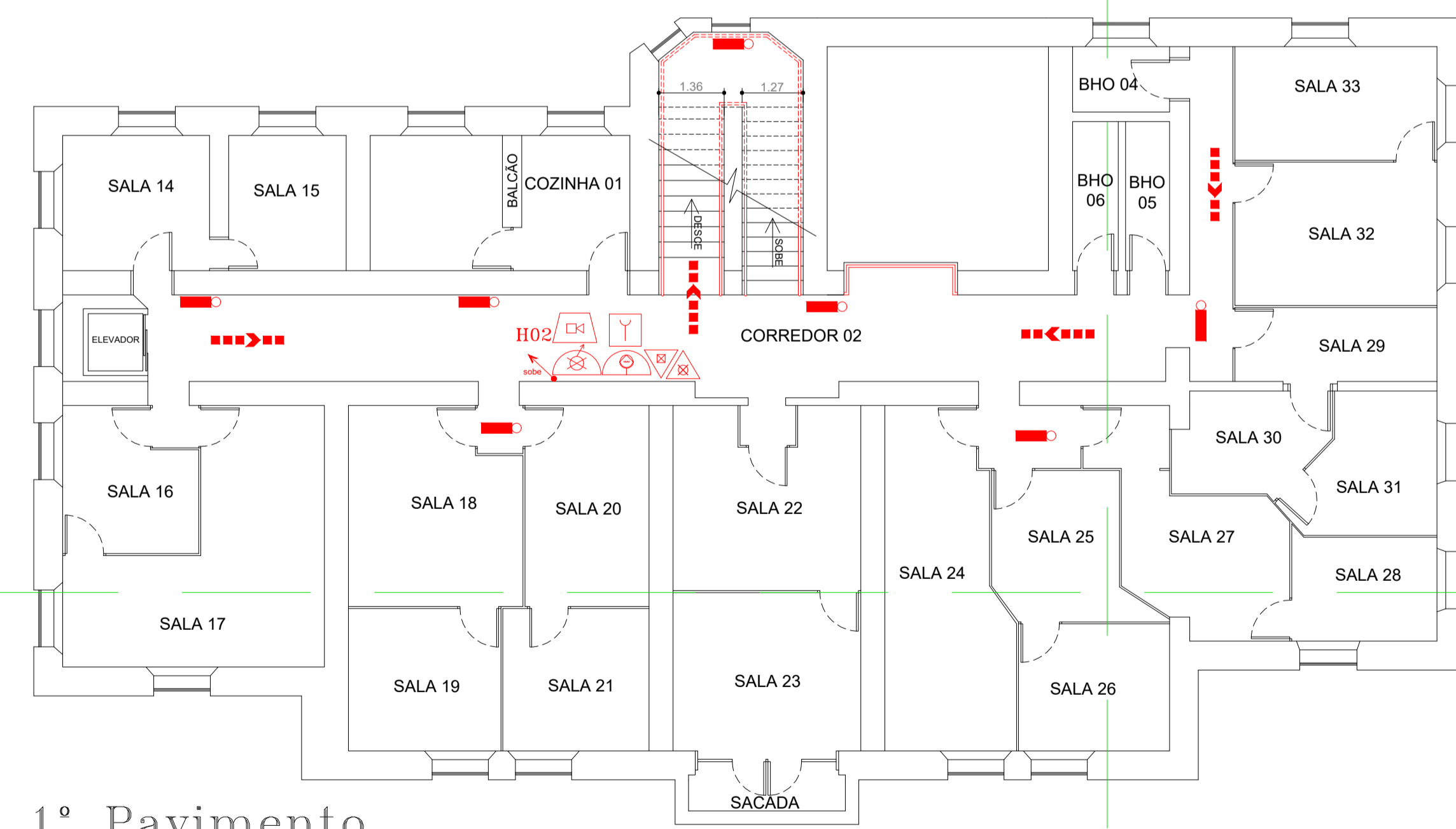
1º Pavimento Esc: 1:100