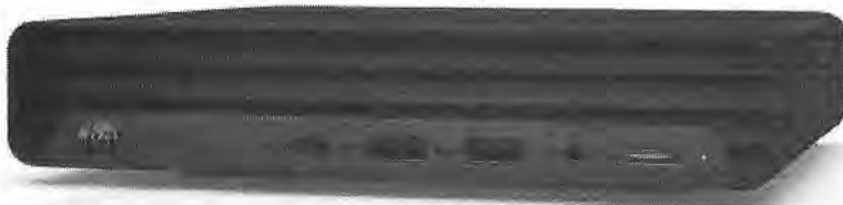
Imagem do produto